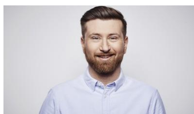
Danijel Nevistic Website & Online Fundraising