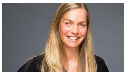
Christine Löprich Projektseiten, Übersetzungen